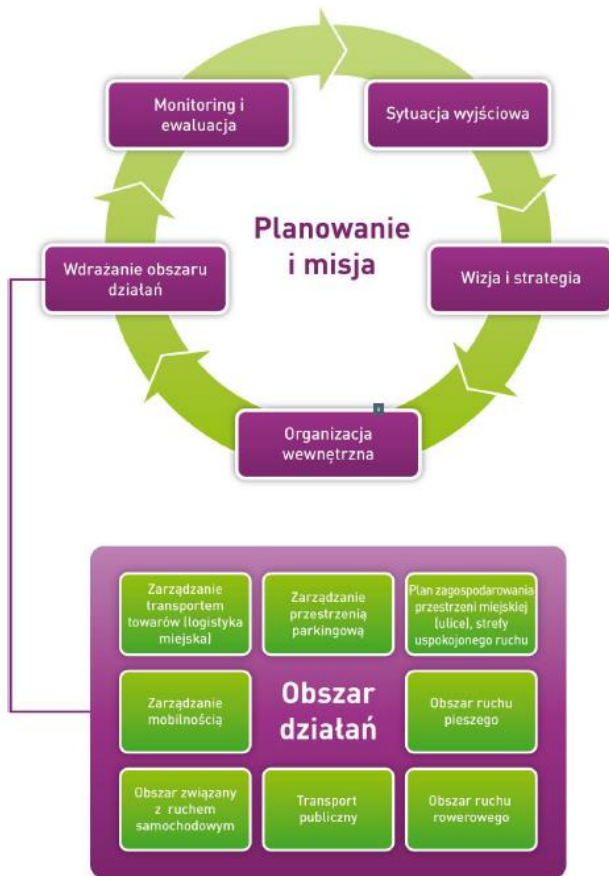
Rysunek 4 Dynamiczny charakter procesu tworzenia SUMP w ADVANCE